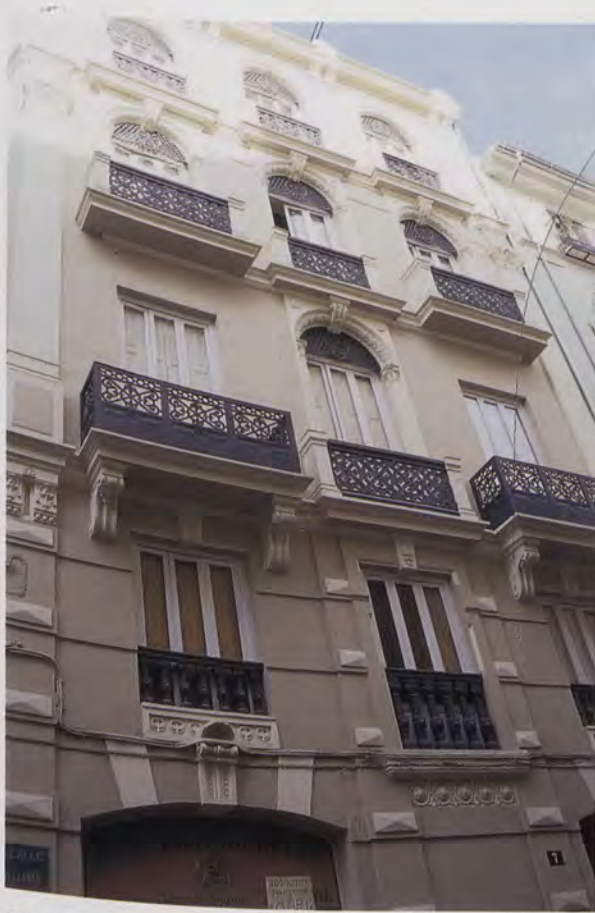
FIG. 4 - PEREGRÍN MUSTIELES: Casa de Eugenio Burriel. Calle de las Avellanas, nº 7. Valencia. Año. 1888.

El edificio ha sido rehabilitado recientemente.