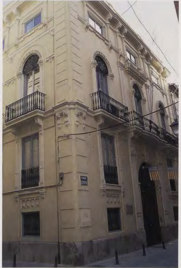
FIG. 1 - PEREGRÍN MUSTIELES: Palacete de Fernando Ibáñez (hoy sede del Colegio de Farmacéuticos). Calle del Conde de Montornés, nº 7. Valencia. Año 1886. (Foto Archivo Javier Delicado).

Edificio de gran prestancia, posee el mismo tratamiento en los vanos de la fachada principal que en la lateral, abriendo en la planta baja un amplio zaguán, que lo centraliza, apto en la época para carruajes. El piso principal ha perdido sendos miradores de madera (que se advertían en las trazas originales del proyecto) tras la rehabilitación a que fue sometido el inmueble para su actual uso.