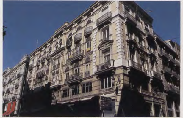
FIG. 5 - PEREGRÍN MUSTIELES. Edificio de viviendas de Fernando Ibáñez Payés. Calle de la Paz, núm. 7 (antigua del Ave María), Valencia. Año 1893. (Foto Javier Delicado).

El edificio, con dos viviendas por planta, consta de piso bajo, entresuelo, tres plantas altas y desván. La fachada principal, de composición central, se estructura en nueve huecos horizontales con empleo de almohadillado y apilastrado de orden jónico, quedando presidida por un pequeño cuerpo saliente que arrancando desde el principal, presenta diverso