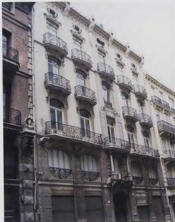
FIG. 6 - PEREGRÍN MUSTIELES Y VICENTE BOCHONS: Casa de Angeles Grau. Calle de la Paz, nº 36. Valencia. Año 1905.

Constituye uno de los primeros proyectos modernistas valencianos, acaso inspirado —como recuerda