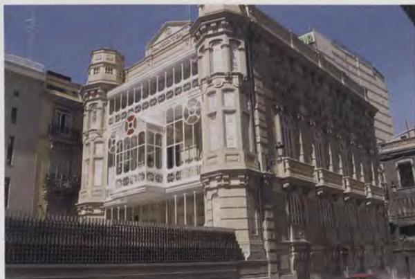
FIG. 2 - PEREGRÍN MUSTIELES: Palacete de Pescara. Calle del Pintor Sorolla, nº 24. Valencia. Año 1893. Detalle de la fachada posterior.

Se trata de una edificación exenta, de cuatro plantas (semisótano, entresuelo, piso principal y ático abuhardillado) con fachadas laterales recayentes a las calles de las Monjas de Santa Catalina (que recuerdan el convento del mismo nombre que existió cercano) y del Bisbe, que constituyen una prolongación de la fachada principal. Dos miradores de madera flanquean el balcón principal sobre la puerta de ingreso; puerta que ciñe un gran arco carpanel que abarca dos plantas dando paso al zaguán, utilizado antaño para el acceso de carruajes, siendo singularísima la escalera que organiza las diferentes plantas. Las fachadas laterales se resuelven con balcones de obra provistos de balaustradas sobre el piso principal.